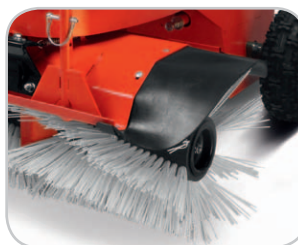
Große Bürste für hohe Arbeitsleistung.