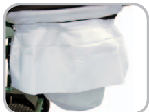
Opt. Staubschutz für Arbeiten ohne Staubfilter.