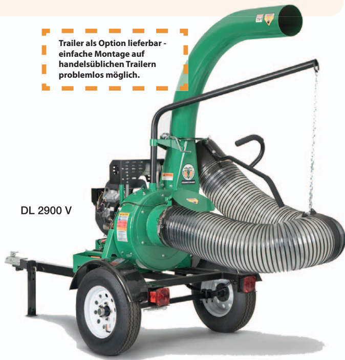
DL 2900 V

Trailer als Option lieferbar - einfache Montage auf handelsüblichen Trailern problemlos möglich.