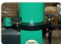
Auswurfkanal 360° drehbar.