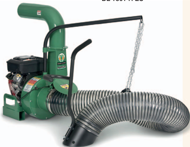
DL 1301 H EU

Die Laubverladegebläse von Billy Goat wurden einer kosmetischen Überarbeitung unterzogen und präsentieren sich sowohl optisch als auch von der Leistung her in absoluter Topform . Diese Geräte zeichnen sich durch hohe Robustheit, absolute Zuverlässigkeit und Langlebigkeit aus. Das neue Piranha™-System bezweckt im Zusammenhang mit dem Schredder-System der absolut schlagbiegefesten Turbinenräder ( 1cm Stärke ) eine Komprimierung des Saugguts auf bis zu 1/12! Außerdem kommt bei der DL-Serie ein komplett neuartiges System zum tragen; Die serienmäßige Ausstattung erlaubt den problemlosen Aufbau auf einen optionalen, bzw. handelsüblichen Trailer , aber zudem ist ein optionales Einhängeset für die Ladebordwand erhältlich, welches mit zwei Schrauben am Gerät installiert werden kann. Durch die flexiblen durchsichtigen Schläuche mit großen Durchmessern können enorme Mengen an Stroh, Laub und Unrat aufgenommen werden. Wenn Sie Geräte für maximale Abfallentsorgung benötigen, ist Billy Goat goldrichtig!