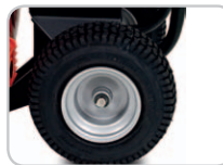
Große luftbereifte Räder.

Mit Einführung der neuen Force™ Laubblasgeräte bietet Billy-Goat den weltweit leistungsstärksten geschobenen Laubbläser an. Die computeroptimierte Entwicklung der Laubbläser erreicht eine Vielzahl von Vorteilen für den Anwender. So lassen sich die Geräte aufgrund der großen breiten Luftbereifung auch selbst auf unebenem Gelände leicht schieben. Bei der Konstruktion des Holmes wurde auf eine ergonomische Ausführung großen Wert gelegt. Bedingt durch die Fertigung aus schlagfestem Spezialkunststoff ist das Gesamtgewicht der Force™ Laubbläser geringer als bei allen Wettbewerbsprodukten dieser Klasse. Abgerundet wird das Programm der Laubblasgeräte durch ein kompaktes Einstiegsmodell.