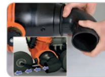
Luftaustrittsrichtungsänderung (Serie außer F601 V).