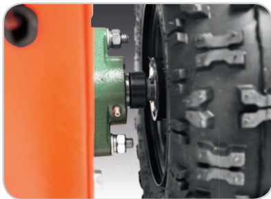
Gusseisener Lagerflansch Serienmäßig.