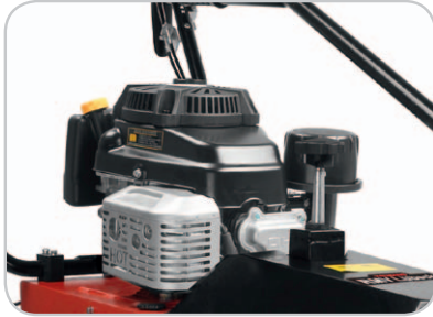
Kraftvoller Kawasaki -Motor.

Haben Sie große oder vielleicht auch kommunale Flächen zu reinigen , bzw. von Schnee und Laub zu befreien ? Möchten Sie diese möglichst müheles und angenehm sauber halten bzw. machen? Dann sind die Vollprofimaschinen RMV 8040 und RMV 10040 mit 0,8, bzw. 1,0 Metern Arbeitsbreite genau richtig. Mit ihren 40 cm Bürstendurchmesser und hubraumstarken Kawasaki Motoren ist dieses Vollmetall-Gerät für den harten Einsatz konzipiert. Einfach zu öffnende Inspektionsluken und Bedienhebel aus Metall ermöglichen dem Anwender einfaches, störungsfreies Arbeiten.