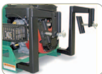
Optionales Einhängeset, einfach zu installieren.