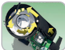
Zentrifugalfiltersystem mit Staubfilter.