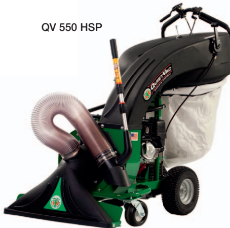
QV 550 HSP

Nicht zuletzt die langjährige Erfahrung der Firma Billy Goat als größter Hersteller von Laub- und Abfallsaugern und die Verwendung hochwertigster Materialien , machen die Geräte zu absoluten „Arbeitsstieren“ für den dauerhaften und harten Einsatz . Die KV-Serie ist serienmäßig mit einer Feinjustierbaren Höhenverstellung und Fangsack ohne Reissverschluss ausgestattet. Die QV-Serie mit bahnbrechenden Neuerungen im Bereich der handgeführten Laubsauger verfügt über einen ergonomischen Führungsholm, einen speziellen Fangsack mit Zentrifugalfiltersystem . Wahlweise geschoben oder mit Hydrostat. Zweifelsohne setzt dieses Gerät in Sachen Lärmreduzierung, Staubfreiheit und Leistung neue Maßstäbe!