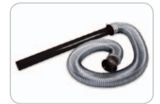
Blasschlauch für unzugängliche Stellen (Option für F 601 S/V).