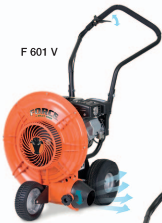
F 601 V