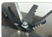
Echt scharf, das Piranha™ Schneidewerk.

Trailer als Option lieferbar - einfache Montage auf handelsüblichen Trailern problemlos möglich.