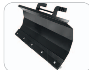
Robustes Schneeräumschild mit Gummileiste und höhenverstellbaren Gleitkufen