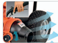
Luftauslass vom Holm aus verstellbar.