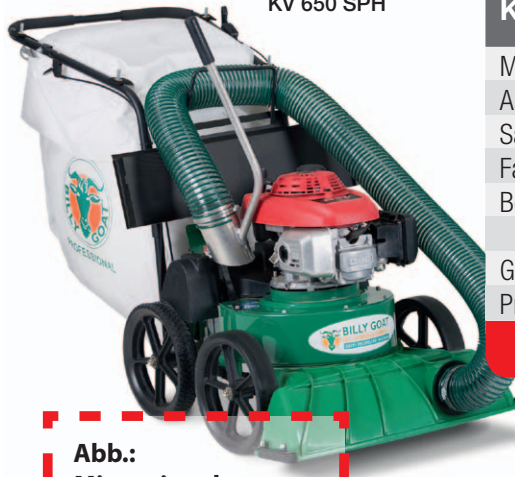
Abb.: Mit optionaler Saugschlauchanitur