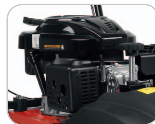
Robuster startfreudiger OHV Motor mit ausreichend Leistungsreserven