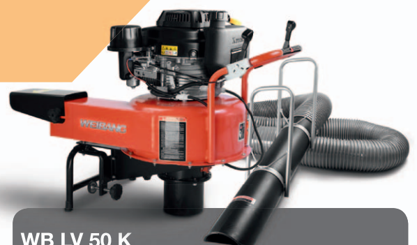
WB LV 50 K

Der Auswurfdeflektor ist verstellbar und erlaubt eine gleichmäßige Befüllung des Fahrzeuges. Ausserdem ist eine Auswurfschachtverlängerung erhältlich. Das im Turbinengehäuse integrierte Zerhacksystem hilft, das Sauggut zu komprimieren und sorgt somit für eine wirtschaftliche Auslastung der Ladefläche.