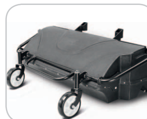
Einfach einzuhängender, leichter und korrosionsfreier Schmutzsammelbehälter