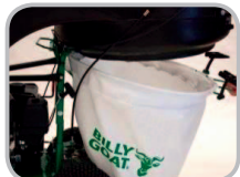
Einfaches Entleeren durch vier Schnellverschlüsse.