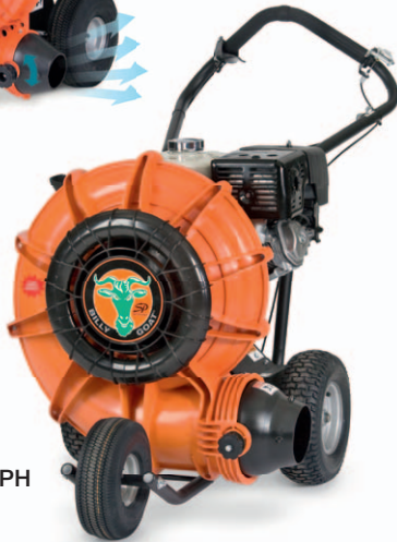
F 1302 SPH